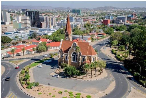
Christuskirche in Windhoek