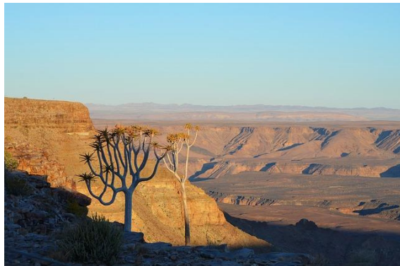
Fish River Canyon