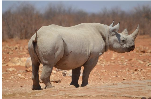
im Etosha National Park