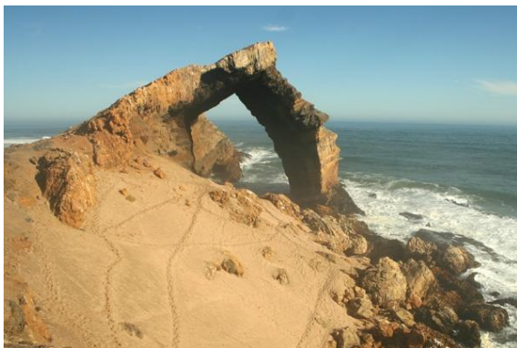
Bogenfels / Lüderitz