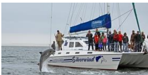
Bootsfahrt in Walfish Bay